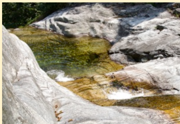
Badestelle in Dunzio