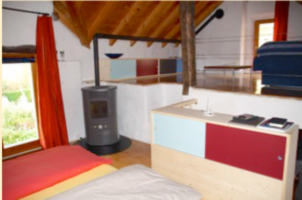
Schlafzimmer im Rustico