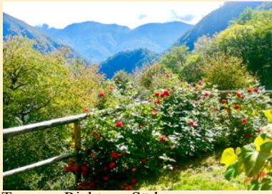
Terrasse Richtung Süden