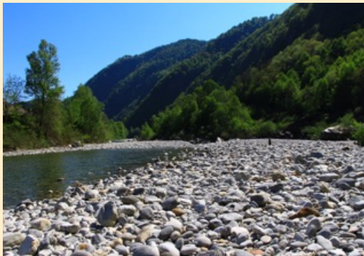
an der Maggia