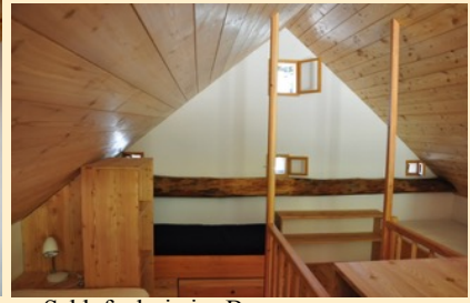
Schlafgalerie im Bewegungsraum